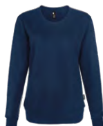
Navy Marin 296C