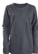
Heather black Chiné noir 433C