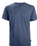
Heather navy Chiné marin 534C