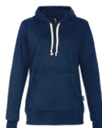
Navy Marin 296C