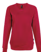
Red Rouge 1945C