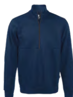
Navy Marin 296C