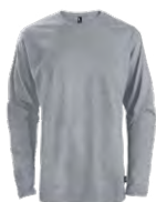
Heather grey Chiné gris Cool grey 9C