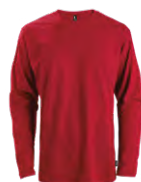
Red Rouge 1945C