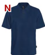
Navy Marin 296C