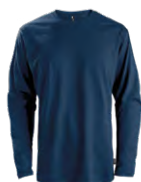
Navy Marin 296C