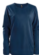
Navy Marin 296C