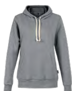
Heather grey Chiné gris Cool grey 9C