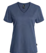
Heather navy Chiné marin 534C