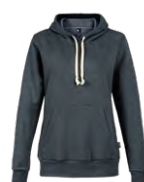
Heather black Chiné noir 433C