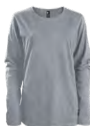
Heather grey Chiné gris Cool grey 9C