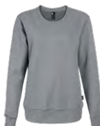
Heather grey Chiné gris Cool grey 9C