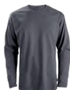
Heather black Chiné noir 433C