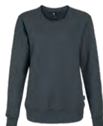
Heather black Chiné noir 433C