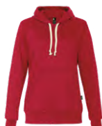
Red Rouge 1945C